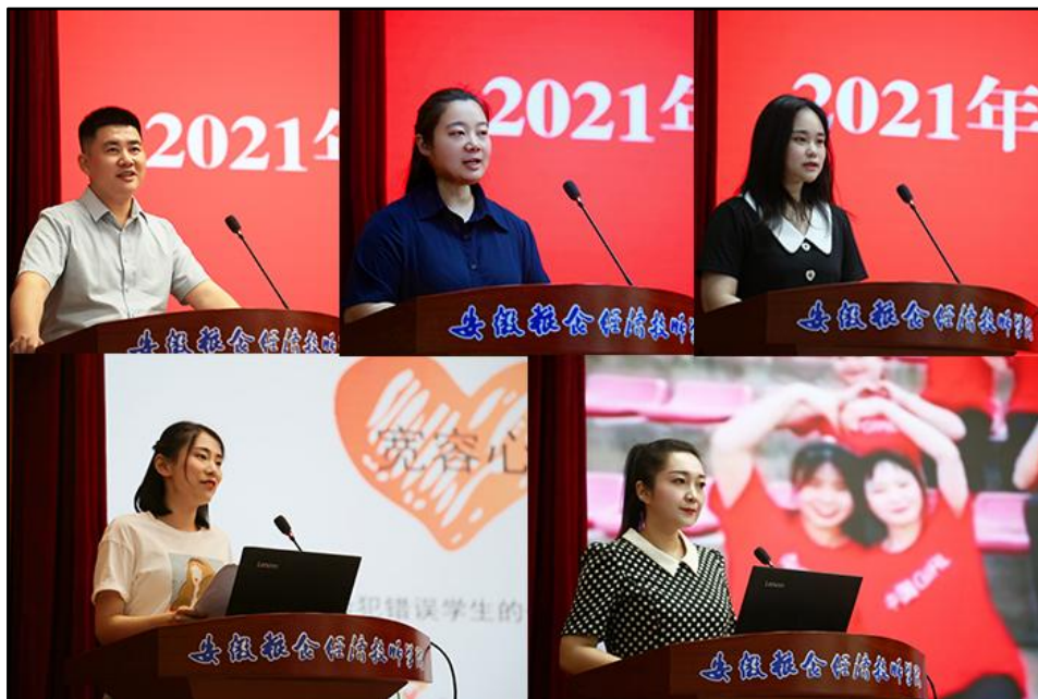
图6 在班主任大赛中屡获佳绩

班主任和德育干部、德育导师、学生干部在实践过程中，互相沟通、交流、切磋，达到了技艺互鉴、情感互融、文化互通效果，工作水平显著提高，团队实力更加强健。13名同志在蚌埠市班主任业务能力大赛中获得二等奖以上荣誉；3名同志荣获全省技工院校优秀班主任称号。