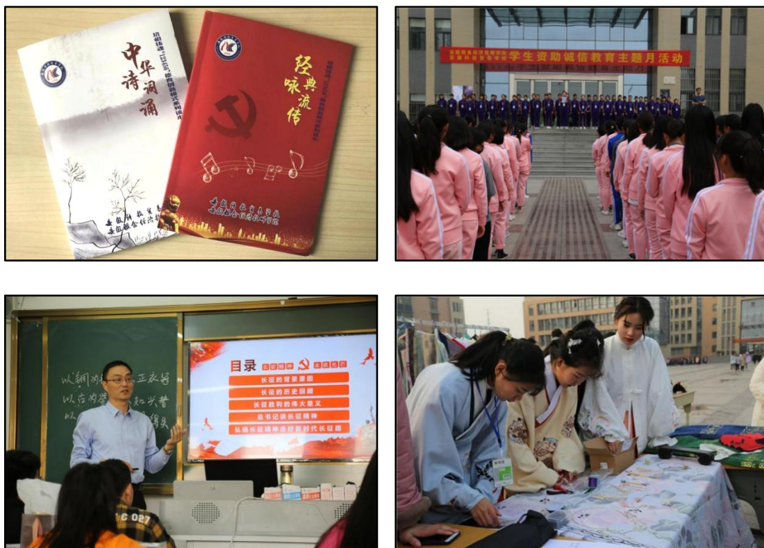
图2 “以文化人，以德育人”品牌项目