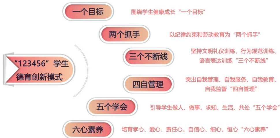
图1 “123456” 学生德育创新模式内涵

断线”，全面深化自我管理、自我服务、自我教育、自我监督“四自管理”，引导学生学会做人、做事、求知、生活、共处“五个学会”，培育孝心、爱心、责任心、自信心、细心、恒心“六心素养”。