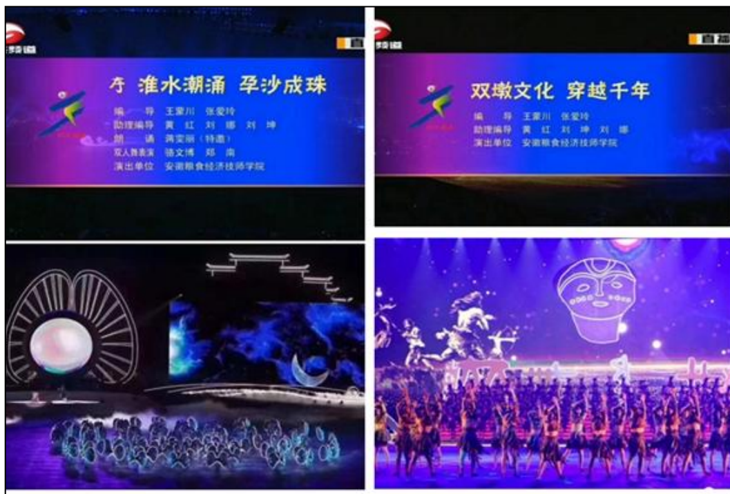
图 5 我校参与省运会开幕式现场