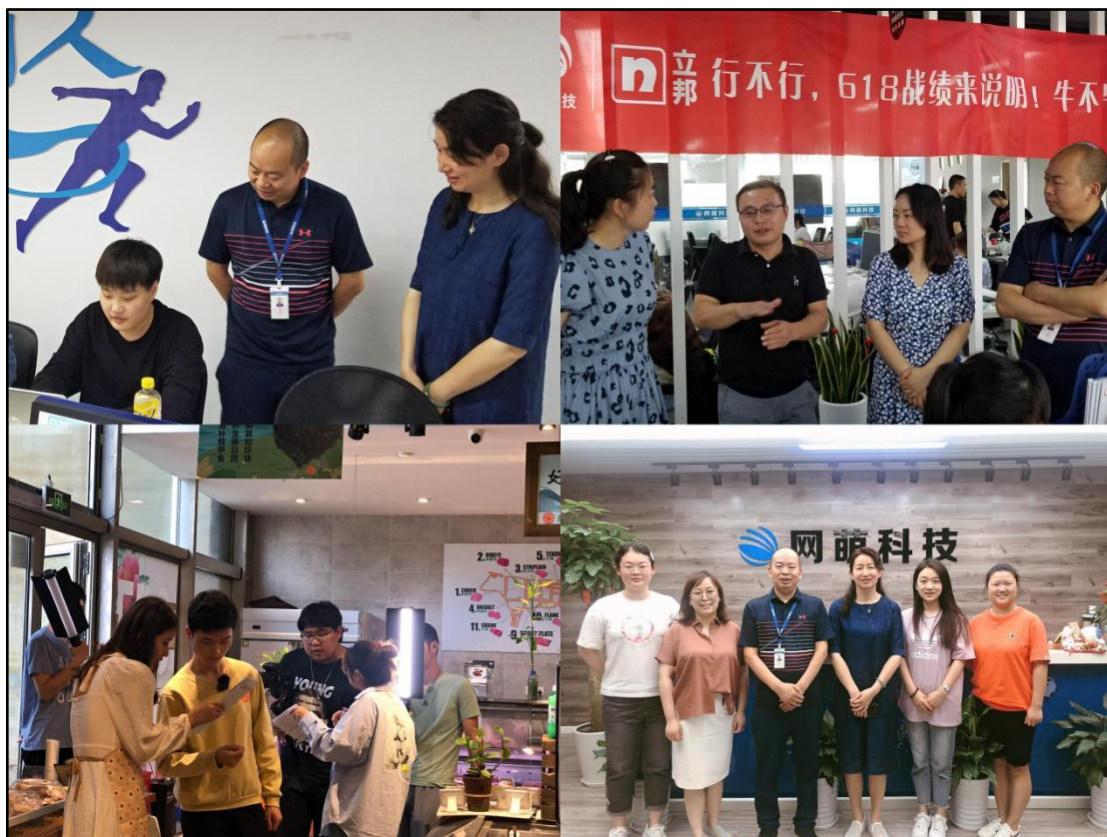
图3 高素质专业化德育工作团队